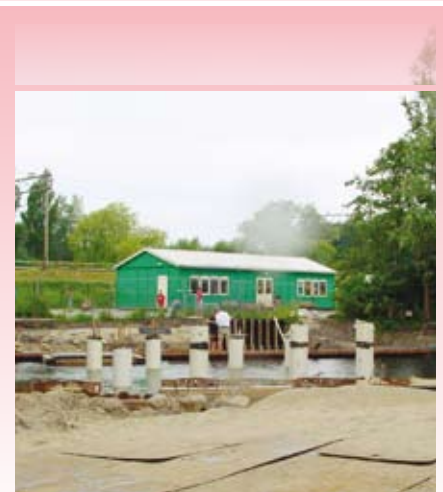
De pijlers van de brug zijn al geslagen en er wordt hard gewerkt om alles volgens planning te laten verlopen

Bij de aanleg van de brug en het fietspad is een gedeelte van het schoolterrein met hekken afgezet als bouwterrein. De gemeente en het schoolbestuur zullen nauwlettend in de gaten houden of het schoolplein voldoende is afgeschermd. De bouw aan de nieuwe brug duurt tot oktober. In september start de aanleg van het fietspad. De gemeente probeert de overlast voor de school zoveel mogelijk te beperken.