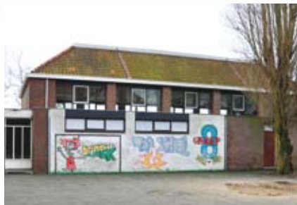
Gymmen wordt een uitje naar een echte sporthal

VERLOOPT ALLES VOLGENS PLANNING, DAN VALT DEZE ZOMER DE HUIDIGE ZAAL TEN PROOI AAN DE SLOOPHAMER.